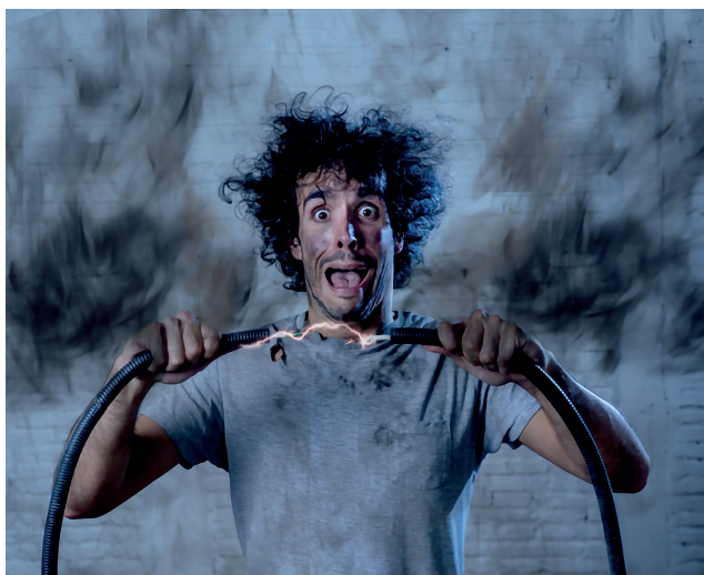
Le mode d'emploi, perdu, le moteur en surchauffe explose ou ne répond plus

Non sans malice, l'essayiste Jean-Michel Delacomptée 7 note que mise au pied du mur, la nature humaine retrouve ses droits : face à la guerre, le peuple ukrainien a immédiatement oublié tous les poncifs genrés : les hommes ont envoyé les femmes à l'abri au-delà des frontières et ce sont eux qui combattent. Et tout le monde admire ! C'est ce qui s'appelle revenir à la réalité.