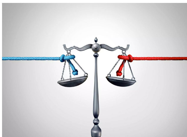
On accorde une valeur illimitée à des « droits » qui s'opposent les uns aux autres.

L'homme peut-il s'affranchir totalement des lois de la nature auxquelles la matière et le monde végétal ou animal sont soumis ? Si l'on considère la partie matérielle de notre être, c'est-à-dire notre corps, la réponse est non. Comme les pierres nous sommes soumis à la loi de l'attraction universelle,